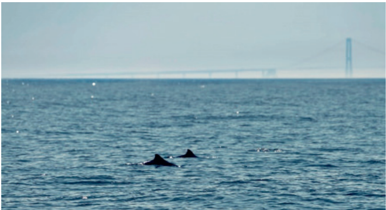
Figur 3: Harbour porpoises in the Baltic Sea.